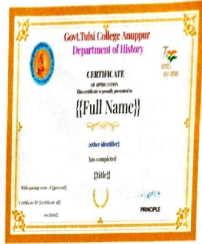
प्रतिभागियों को प्रदान किए गए ई-प्रमाण पत्र