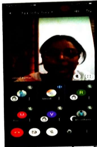
ऑनलाइन व्याख्यान के छायाचित्र

PRINCIPAL Govt. Tulsi College Anuppur Distt. Anuppur (M.P.)